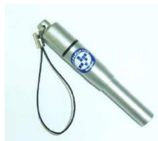
メタリックシルバー